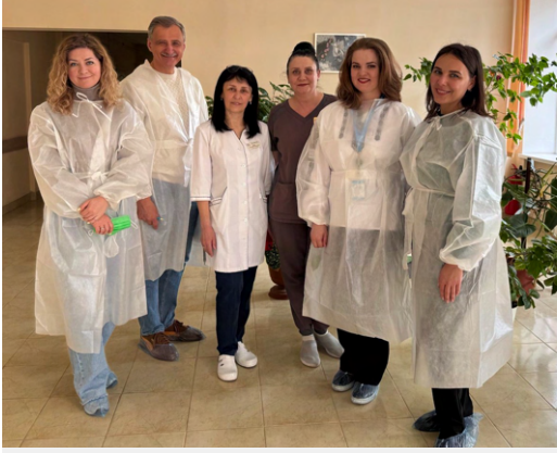
Команда моніторингового візиту під час оцінки впровадження оновленого календаря щеплень у Вінницькій області, квітень 2026 року.

SAFEMed у партнерстві з Центром громадського здоров'я (ЦГЗ) та ВООЗ продовжує підтримувати загальнонаціональне впровадження оновленого календаря профілактичних щеплень в Україні через серію регіональних моніторингових візитів.