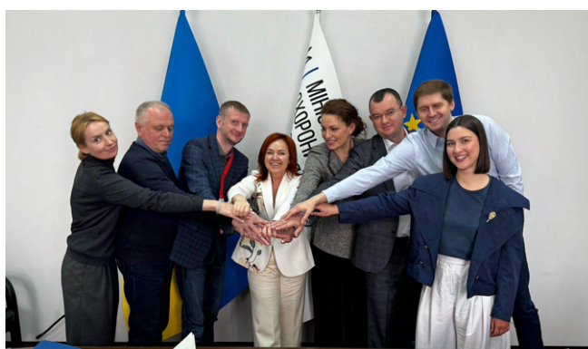
Заступниця міністра охорони здоров'я України Марина Сlobодніченко разом з експертами SAFEMed і залученими експертами проєкту, які входять до мультидисциплінарної Twinning-команди України, квітень 2026 року.

Очікується, що сильніше й передбачуваніше регуляторне середовище покращить доступ до якісних лікарських засобів, посилить довіру до системи та створить стабільніші умови для роботи фармацевтичного сектору в Україні. Для підтримки цього процесу SAFEMed також сприяє проведенню регулярних стратегічних засідань Консультативної ради (Advisory Board) щодо створення державного регуляторного органу, формуючи структурований майданчик для діалогу між українськими та міжнародними експертами. У сукупності ці зусилля допомагають забезпечити, щоб створення Української фармацевтичної агенції було не лише технічно якісним, а й операційно спроможним та чутливим до ширших потреб системи охорони здоров'я.