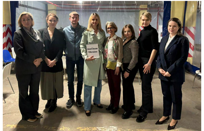
The meeting took place in a shelter due to the security situation in Kyiv, underscoring stakeholders' continued engagement despite ongoing challenges.

Зустріч сприяла підтримці відкритого діалогу між SAFEMed і представниками приватного сектору, а також подальшому залученню стейкхолдерів до ключових фармацевтичних реформ, що формують систему охорони здоров'я України.