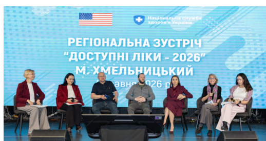
Відкриття регіональної зустрічі програми «Доступні ліки», 4 травня 2026 року, Хмельницький

Аби програма «Доступні ліки» працювала однаково ефективно по всій країні, пацієнти мають мати рівний доступ до необхідних лікарських засобів незалежно від місця проживання. Саме тому Національна служба здоров'я України (НСЗУ) за підтримки проєкту «Безпечні, доступні та ефективні ліки для українців» (SAFEMed), який фінансується урядом США, продовжує серію регіональних зустрічей, присвячених практичним аспектам реалізації програми.