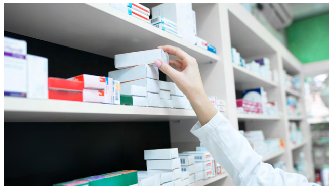
Створення Українського фармацевтичного агентства сприятиме посиленню державного регулювання лікарських засобів і медичних виробів та наближенню фармацев-

Проєкт «Безпечні, фінансово доступні та ефективні ліки для українців» (SAFEMed) здійснюється з метою підтримки зусиль уряду України щодо реформування системи охорони здоров'я та покращення доступу населення до доступних та надійних ліків. За підтримки уряду США MSH надає технічну та юридичну допомогу для зміцнення фармацевтичної галузі України. Наша робота в Україні спрямована на підвищення прозорості, покращення економічної ефективності та зміцнення фармацевтичних ланцюгів постачання задля покращення доступу та використання основних лікарських засобів та товарів медичного призначення для лікування туберкульозу, ВІЛ та СНІДу, COVID-19 та неінфекційних захворювань. Ми підтримуємо уряд України в зусиллях щодо реформування системи охорони здоров'я під час війни.