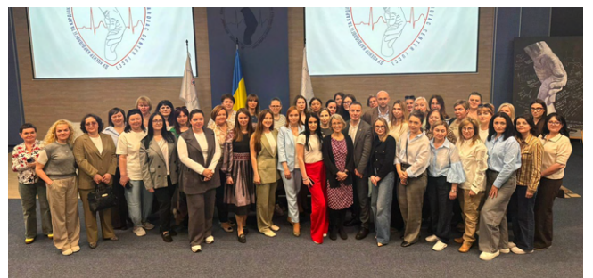
Семінар «Регіональні ДКД: як долучитися до механізму та запровадити його у своєму регіоні», Київ, 5 травня 2026

Результати та пропозиції, зібрані під час регіональних зустрічей, уже використовуються для планування наступного етапу підтримки впровадження ДКД. SAFEMed і надалі надаватиме регіонам методичну та технічну допомогу, зокрема через підготовку практичних рекомендацій і роз'яснювальних матеріалів для зацікавлених сторін.